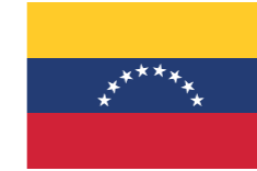
République bolivarienne du Venezuela

Cette exposition importante est devenue un espace privilégié pour nouer des partenariats qui contribueront au développement d'un secteur touristique plus durable, inclusif et prospère pour tous. Nous avons une fois de plus confirmé notre statut de destination internationale de premier ordre. Le Venezuela a fait preuve de son immense diversité, de la richesse de sa culture et de ses paysages uniques, offrant à ses visiteurs des expériences inoubliables.