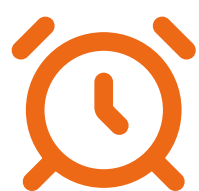
ГРАФИК РАБОТЫ ЦЕНТРА АККРЕДИТАЦИИ

Организационный комитет оставляет за собой право отказать в аккредитации без объяснения причин.