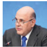
米哈伊尔·米舒斯京

论坛进行过程具有建设性及创意性，其决策有助于下一步形成具有竞争力的旅游市场、提升服务品质、培养人才等项目，推广俄罗斯为最有趣及最好客的旅游目的地之一。